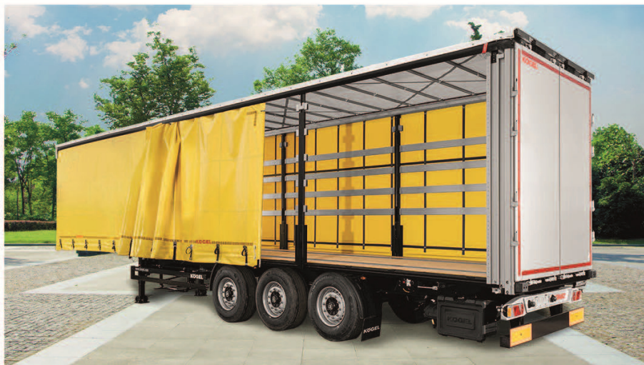
Der Bambusboden hält einer Staplerachslast von ca. 7,2 Tonnen stand.

Bambus ist zudem ein sehr robuster und langlebiger Werkstoff, so dass Sie auch bei der bewährten Haltbarkeit Ihres Kögel-Trailers keine Abstriche machen müssen. Tragfähigkeit, Wasserbeständigkeit, Abriebverhalten und Reparaturfähigkeit befinden sich auf dem gewohnt hohen Niveau.