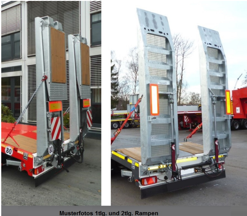
Musterfotos 1tlg. und 2tlg. Rampen